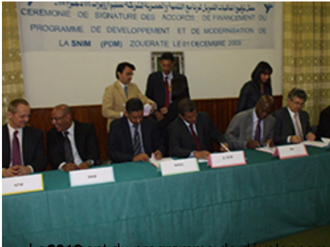
La signature du programme de développement et de modernisation de la SNIM, composé de plusieurs